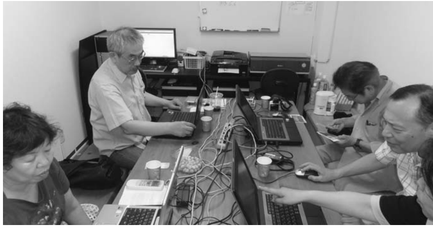
毎週土曜日のパソコン教室風景

高宮商店街振興組合事務所(高宮3丁目7番10号)がこのほどリニューアルされました。高宮サロンとして地域に開かれたコミュニティ広場となっております。ミニ会議、サークル活動等にご利用下さい。 現在、理事会をはじめパソコン教室、キャリアアップ講座、絵画教室に利用されております。 ご利用の申し込み相談は 電話・ファックス521-9192又は事務所入り口のポストに連絡先を記入いただいたり投函下さい。