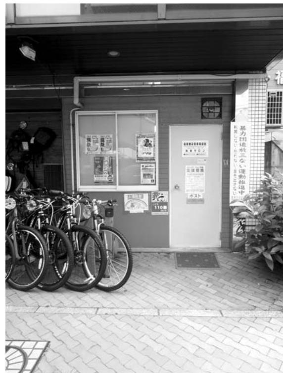
高宮駅前歩道橋下の自転車屋さん横 組合事務所(高宮サロン)入り口