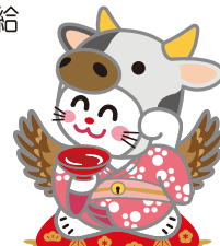
タカミヤ〜(五年バージョン)